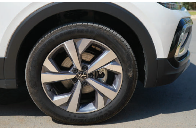
Belmont 17 inch | Luxury