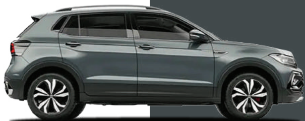
Xám Carbon Metallic