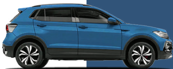
Xanh Rising Blue Metallic