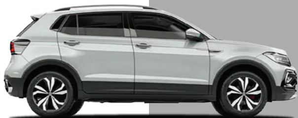
Bạc Reflex Metallic