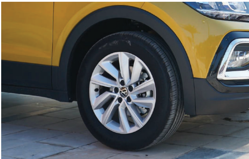
Cassion 16 inch | Elegance