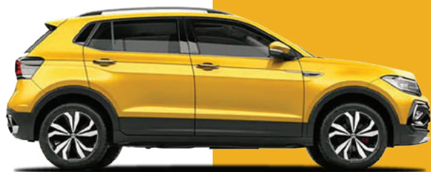
Vàng Curcuma Metallic