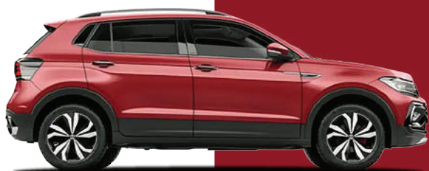
Đỏ Cherry Metallic